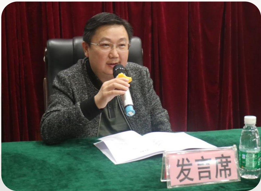
区县管理员代表发言